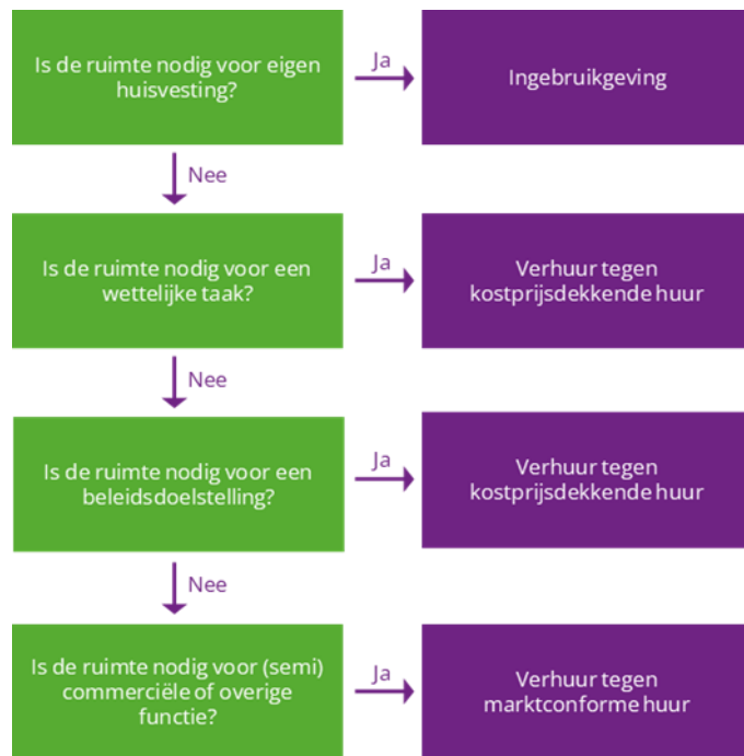
Figuur 5 Beslismodel verhuur van gemeentelijk vastgoed

Onderstaand beslismodel geeft de kaders van het huurprijsbeleid weer.