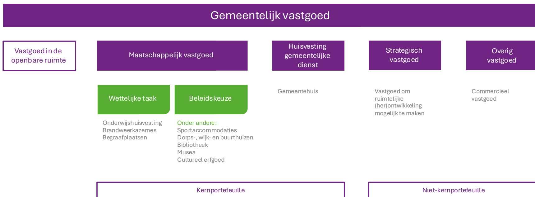
Figuur 1 Vastgoedportefeuille gemeente De Wolden

De kernportefeuille is grotendeels in direct eigendom van de gemeente, maar er zijn ook gebouwen die in indirect eigendom van de gemeente zijn. Zo beschikken we momenteel over 14 schoolgebouwen waarop het economisch claimrecht van toepassing is.