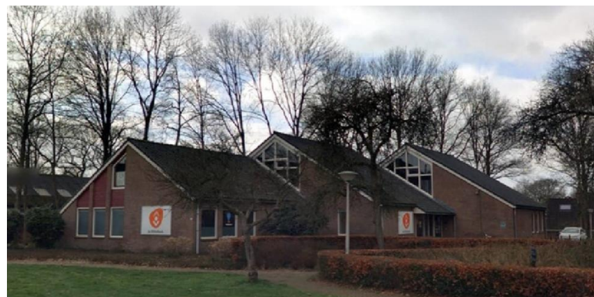
Figuur 4 Sloop bibliotheek Zuidwolde