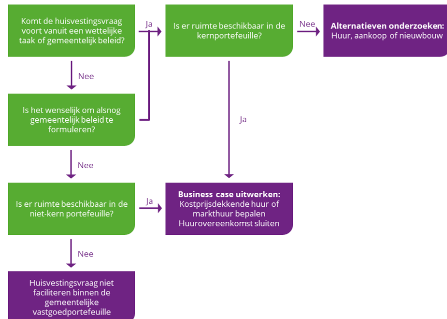
Figuur 3 Afwegingskader nieuwe huisvestingsvragen