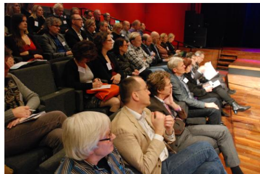
Tekst: Anneke Hazelebach en Ingrid de Moel

De toekomst ligt in de toegevoegde realiteit (in het Engels: augmented reality ). Dat is een live, direct of indirect, beeld van de werkelijkheid waaraan elementen worden toegevoegd door een computer. Deze soms met behulp van QR-code toegevoegde elementen bevatten veelal sensordata of extra informatie over de omgeving. Ter illustratie wordt in een filmpje toegelicht waar de menging tussen de digitale en fysieke wereld over 10 jaar toe kan leiden. Suggestie voor een nieuw tegeltje: als er veel verandert dan zijn er veel kansen.