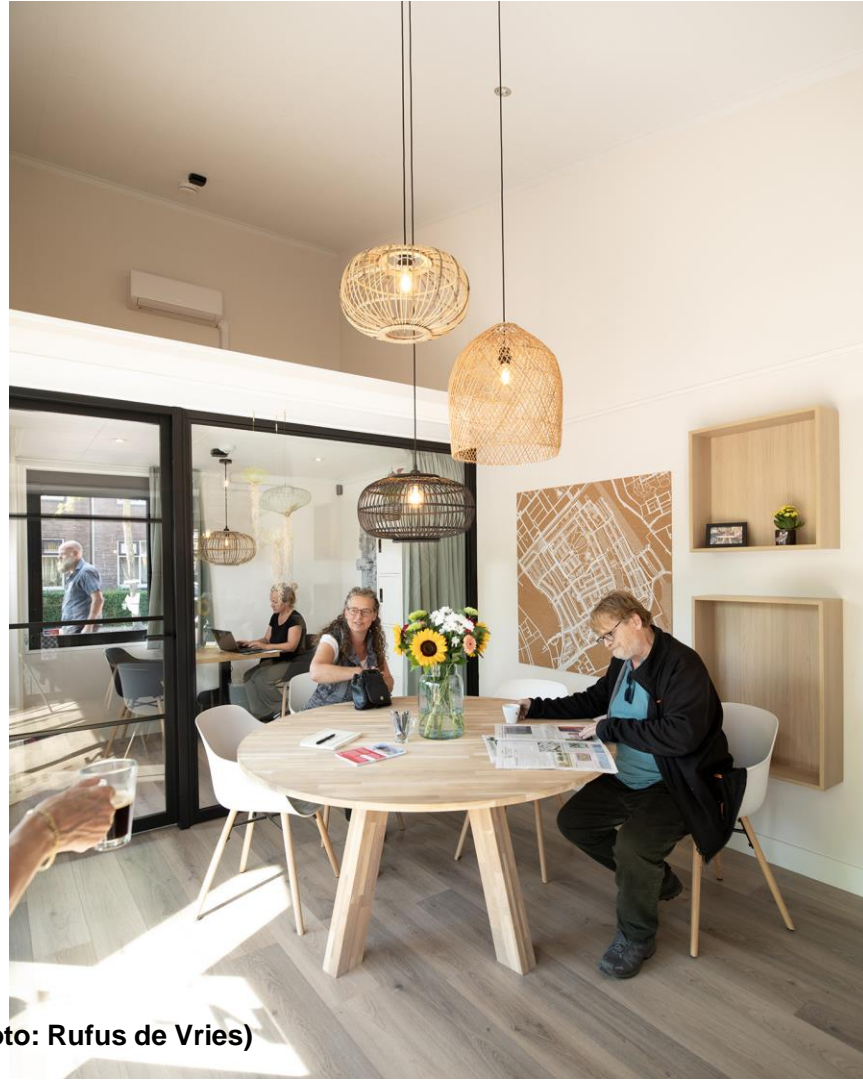
MICHI NOEKI