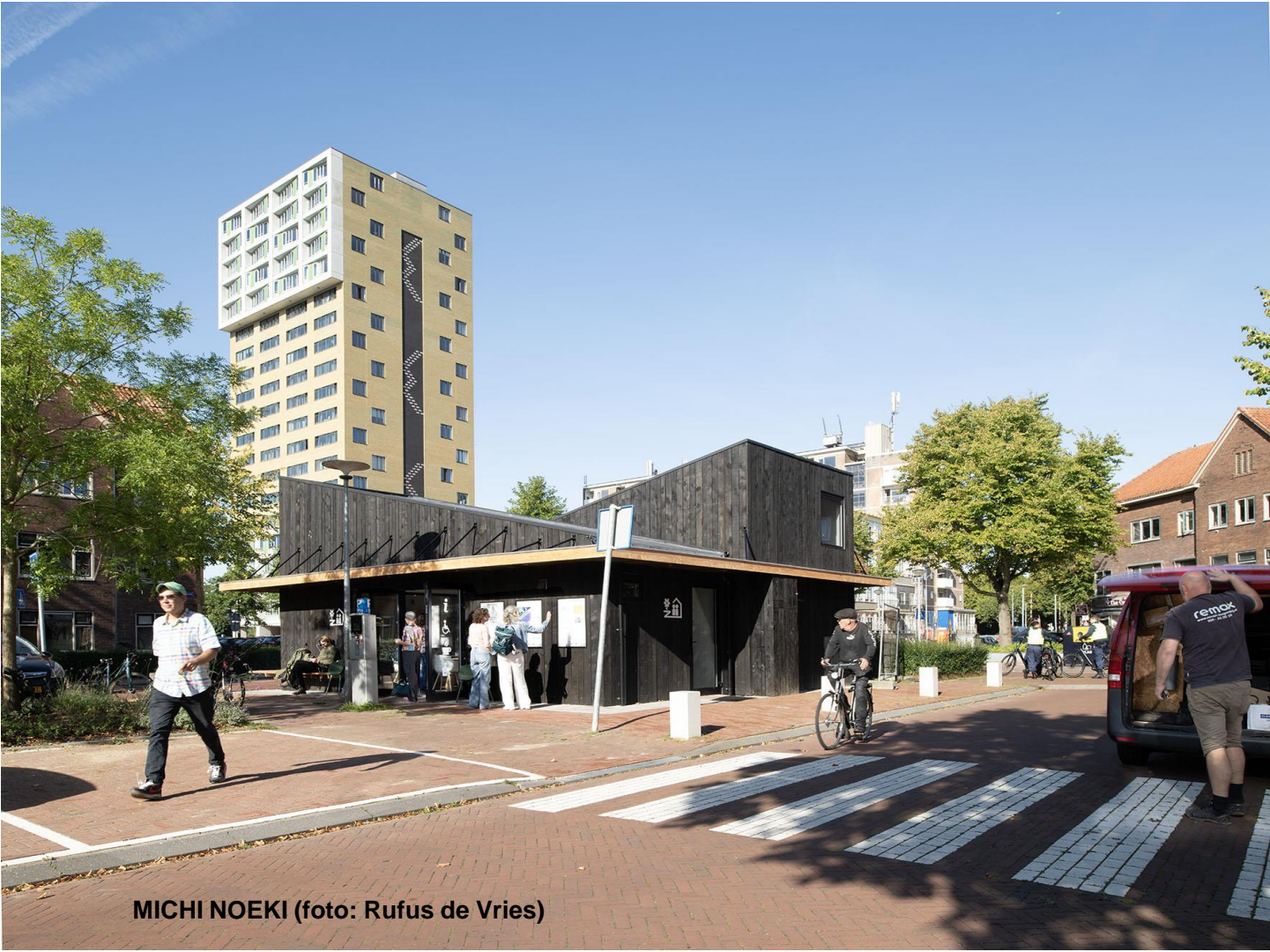
MICHI NOEKI