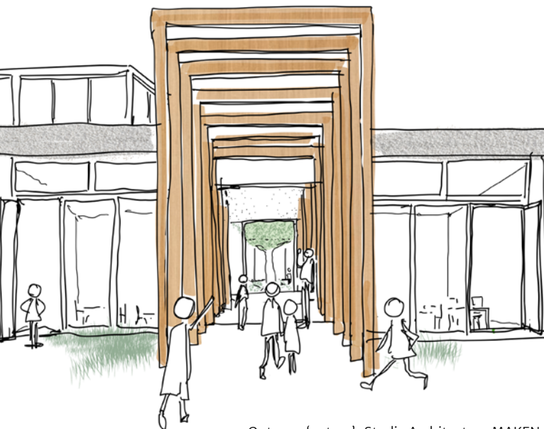
Ontwerp 'entree', Studio Architectuur MAKEN