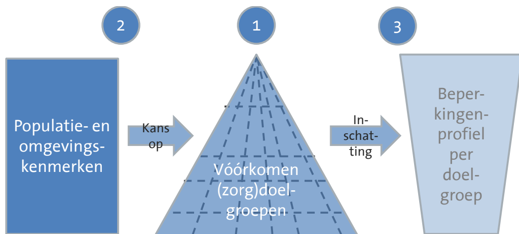
Figuur 2 Eerste fase ontwikkeling Woonzorgwijzer

Om meer scherpte te krijgen om welke mensen het gaat, wat hun beperkingen zijn en welke condities helpen bij het zelfstandig (blijven) wonen, zijn interviews gehouden met professionals die met een of meer groepen zorgvragers te maken hebben. Er zijn interviews gehouden met drie typen deskundigen: