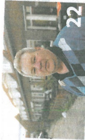
Crisis knijpt door