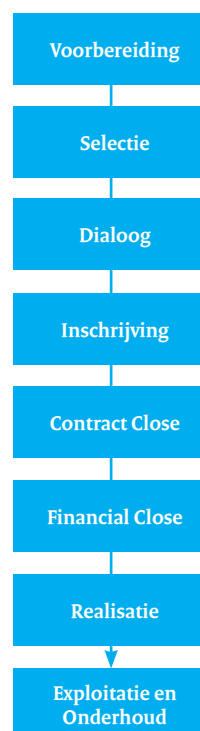
Figuur 1 stappen in concurrentiegerichte dialoog

Ter illustratie zijn hieronder stappen in de concurrentiegerichte dialoog weergegeven 7 .