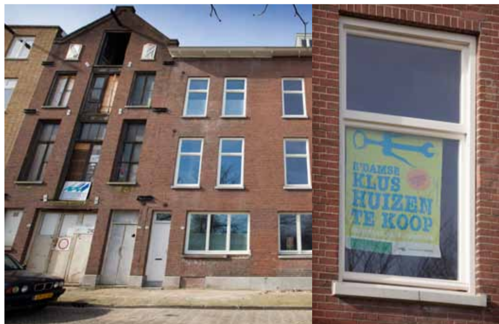
Klushuizen aan de Wollefoffenstraat te Rotterdam

Niet langer is uitsluitend de behoefte van de gemeente leidend, aldus Blom. "We laten veel van de markt afhangen. Om dat proces te stroomlijnen moeten we kritisch naar de eigen organisa-