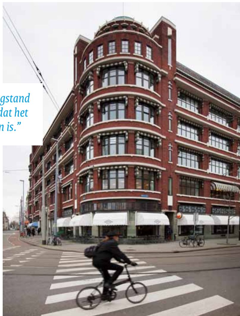
Rijksmonument Atlantichuis is getransformeerd naar o.a. 40 appartementen en 10 maisonnettes

"De omvang van de leegstand is zo snel toegenomen dat het niet meer te verbloemen is."