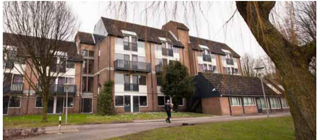
Flexhotel Zuiderpark, Rotterdam. Dit gebouw werd, mede dankzij de meewerkende houding van de gemeente, binnen een half jaar getransformeerd tot short stay huisvesting voor 280 arbeidsmigranten.

In Nederland loopt het aantal EU-arbeidsmigranten uit Midden- en Oost-Europa al jaren sterk op. In 2008 was het totaal geschatte aantal EU-arbeidsmigranten 280.000, in 2009 waren dat er 305.000 en in 2010 340.000. De schattingen laten zien dat de groep lineair groeit. Of deze flexwerkers nu voor een korte termijn of juist langer in Nederland verblijven, een basisvoorwaarde is betaalbare en goede (tijdelijke) huisvesting. Hun woonomstandigheden zijn vaak nog onvoldoende en dit kan leiden tot overlast, verloedering en onveilige situaties. Al is de vraag van één arbeidsmigrant naar woonruimte soms heel tijdelijk, de vraag van arbeidsmigranten als (groeïende) groep is door het hele jaar heen een permanent verschijnsel. Dit resulteert in een blijvende vraag naar (tijdelijke vormen van) huisvesting.