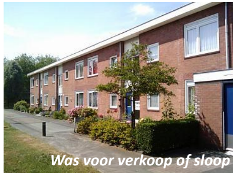
Was voor verkoop of sloop

Voor studenten en vergunninghouders Door inzet reeds gebruikte units