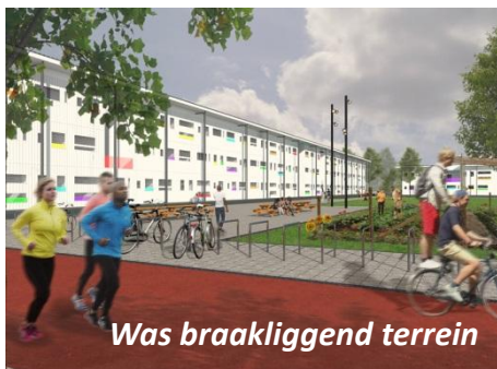
Was braakliggend terrein

Door gebruik lege gronden, scholen, (buurt- en verzorgings-)huizen, kantoren en ander maatschappelijk vastgoed